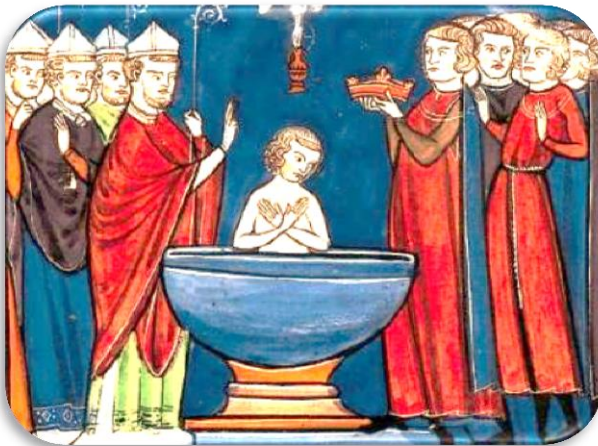
Le baptême de Clovis, XIV e Xv e , enluminure

En 481, un chef franc, Clovis, devient le premier roi de tous les Francs dans ce royaume. Puis, il s'empare de toute la Gaule Romaine. Clovis se convertit au christianisme vers 496. Ses successeurs forment la dynastie des Mérovingiens.